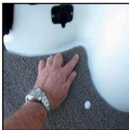
Positionnement de la partie mâle. La portion mâle du bouton pression se fixe sans percer de trous.