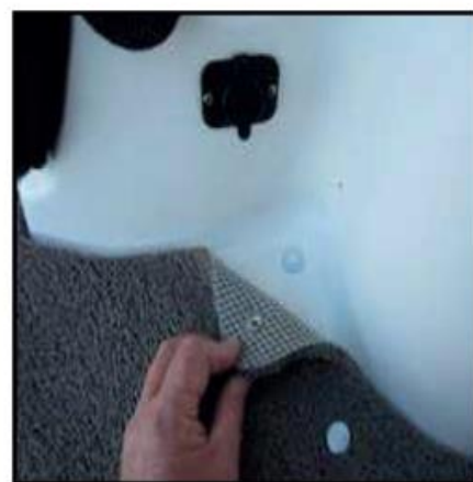
Portion mâle autocollant. Retiré le papier recouvrant l'adhésif et bien pressé en place.

La pellicule de plastique peut être replié pour réduire sa dimension en prenant soins de ne pas former de mauvais pli, enroulé votre patron et placer ce dernier dans un tube pour expédition. Inclure votre nom complet, adresse, numéro de téléphone la marque et modèle ainsi que l'année de votre bateau.