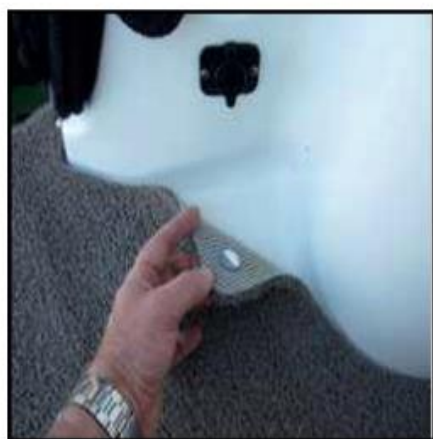
Portion femelle installé sur le tapis

Le DMF ne nécessite généralement pas de boutons pression autre que pour la planche de baignade ou pour les marches. Si vous n'avez pas de boutons pressions et vous croyez en avoir besoin, indiquer leurs positions sur le plastique. Nous installerons la partie femelle du bouton en acier inoxydable aux positions indiquées sur le tapis Deckadence avec un support en vinyle transparent. Nous vous fournirons la contrepartie du bouton pression avec vis ou sans endos autocollant selon la situation.